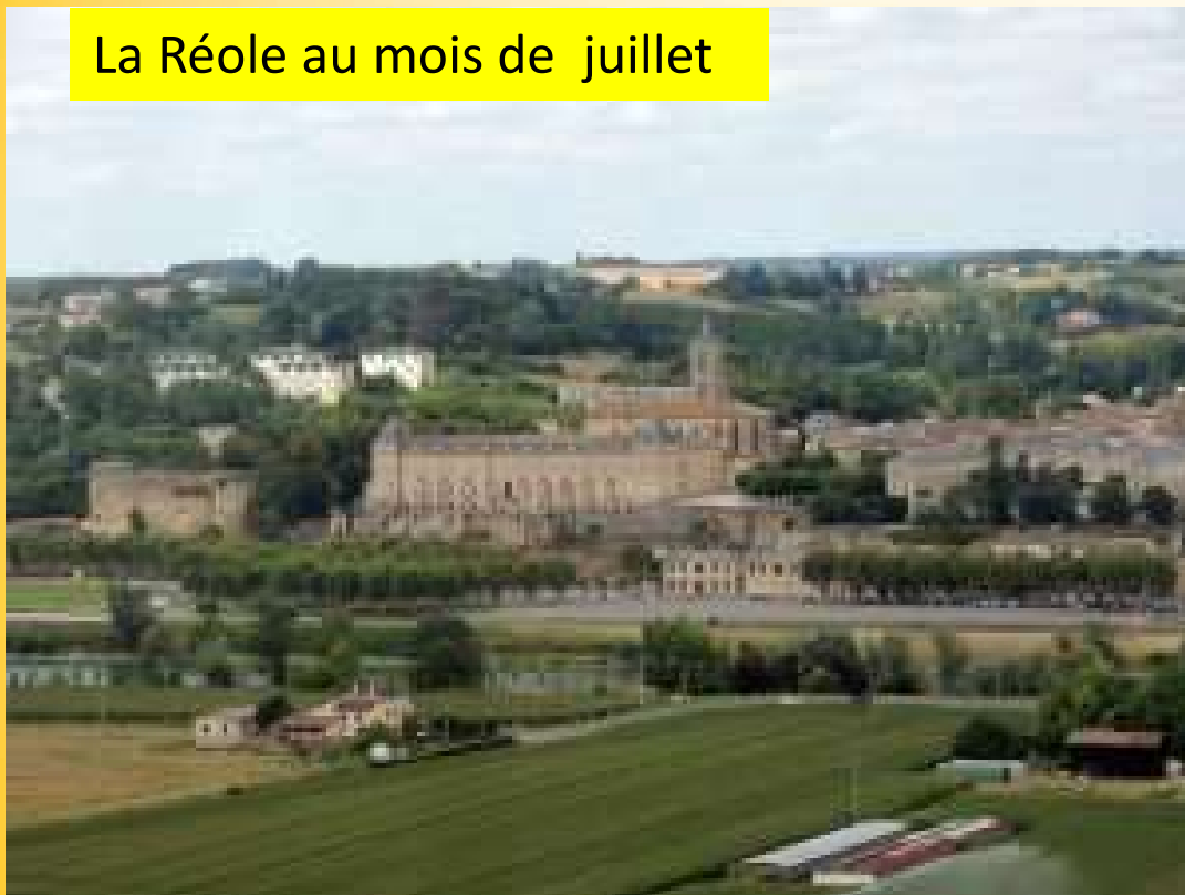
La Réole au mois de juillet