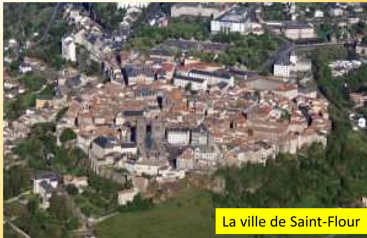
La ville de Saint-Flour