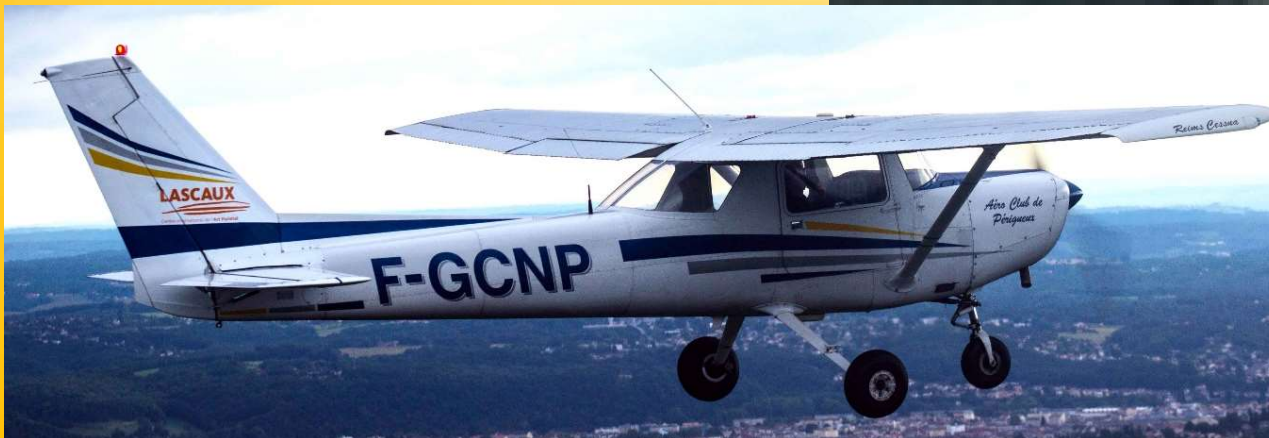
Le Cessna 152