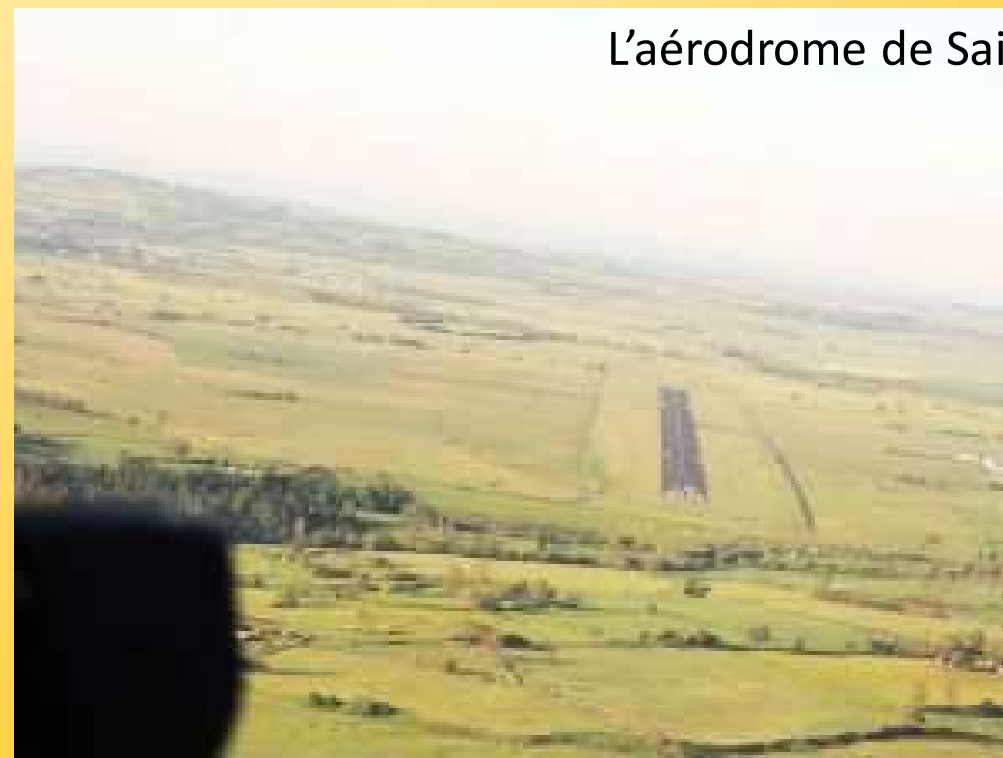
L'aérodrome de Saint Flour