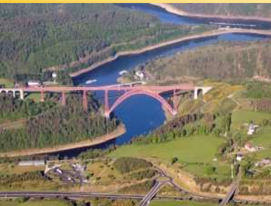
Viaduc de Garabit