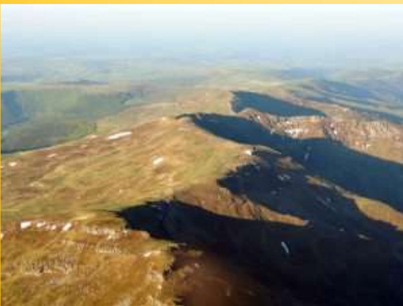
le plomb du cantal