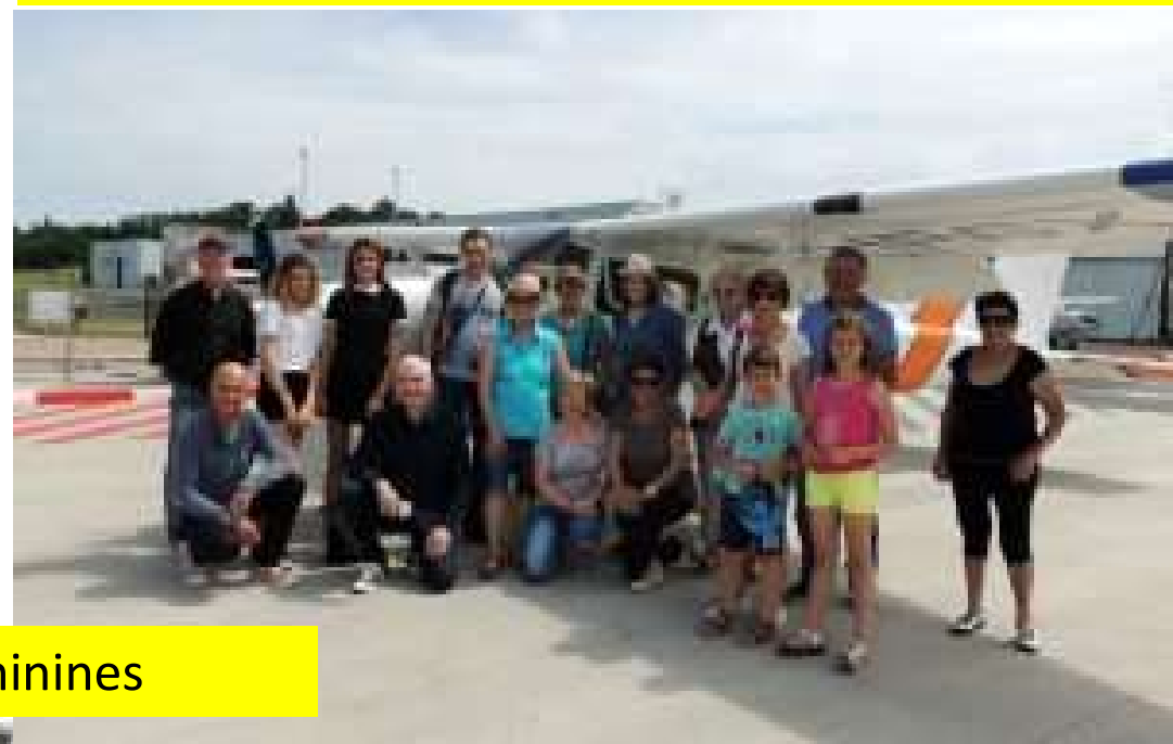
Les vols découverte