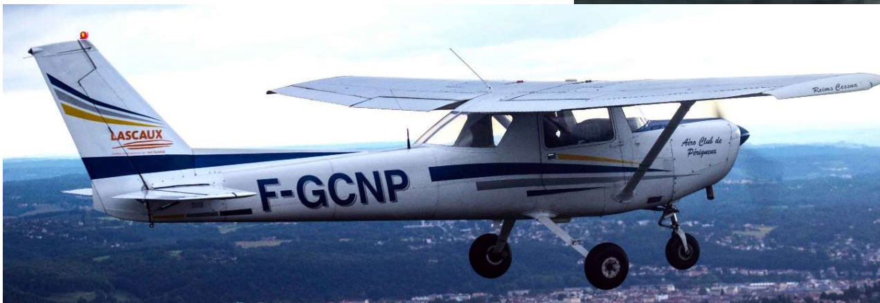
Le Cessna 152