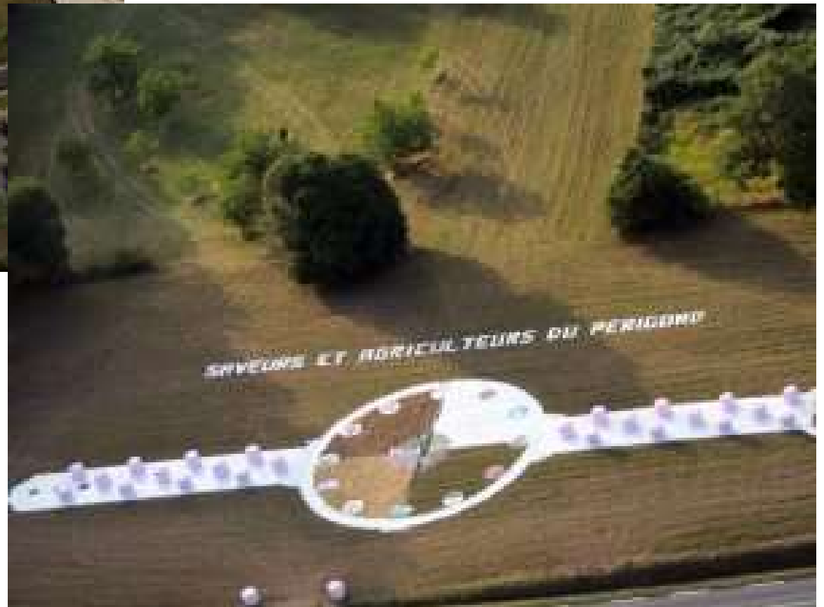
Les agriculteurs du Périgord