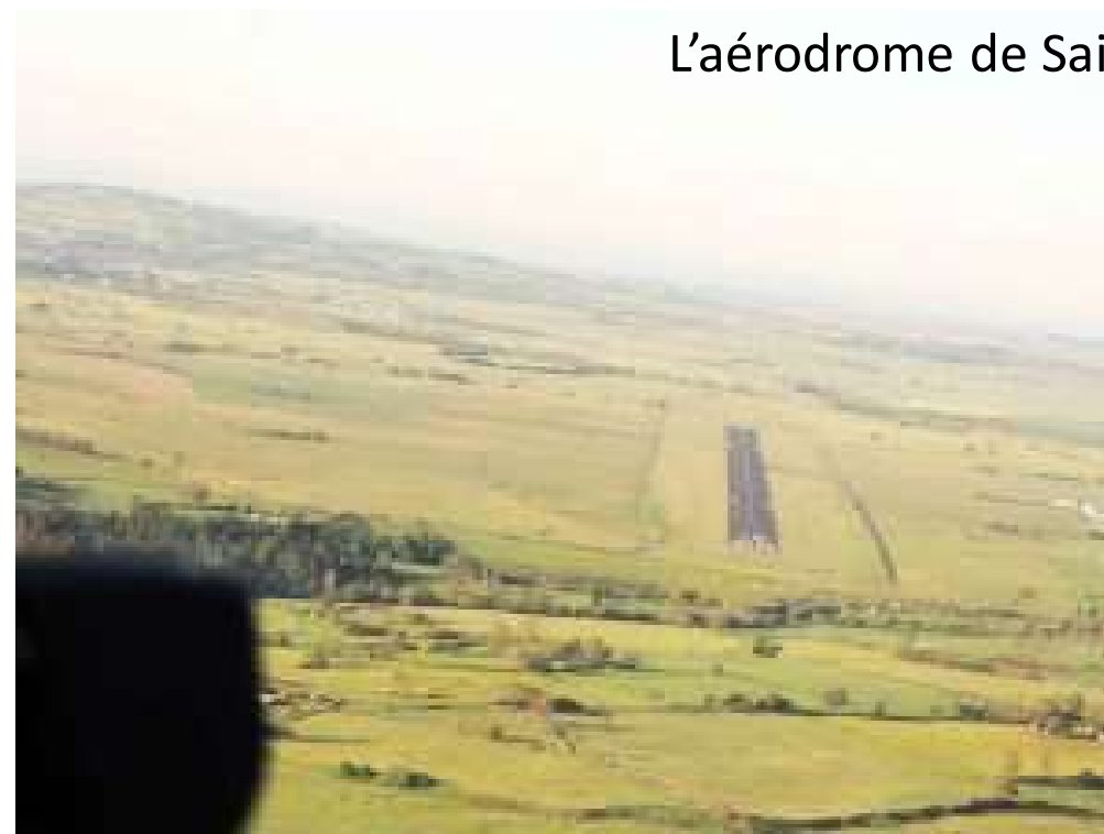
L'aérodrome de Saint Flour