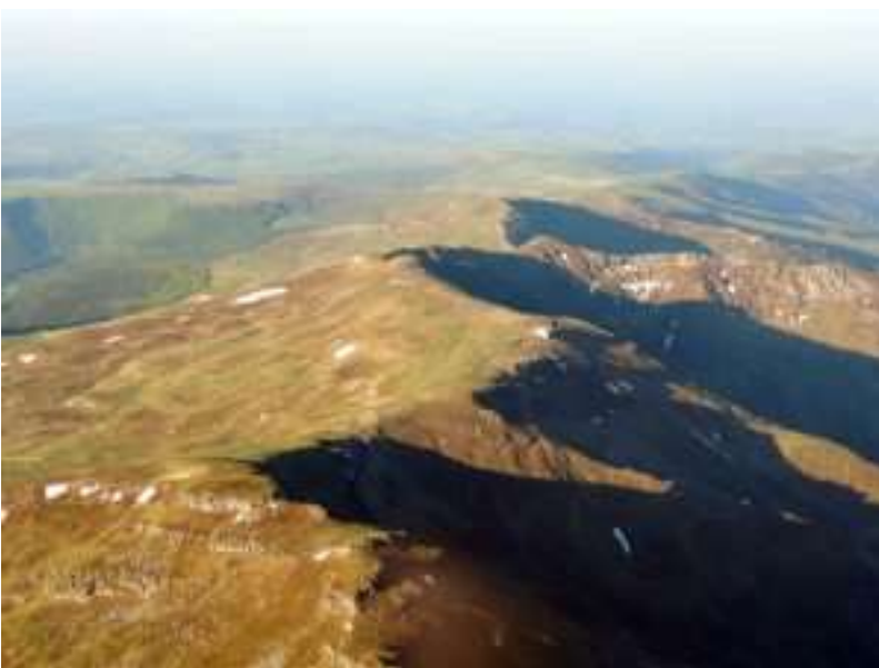
le plomb du cantal