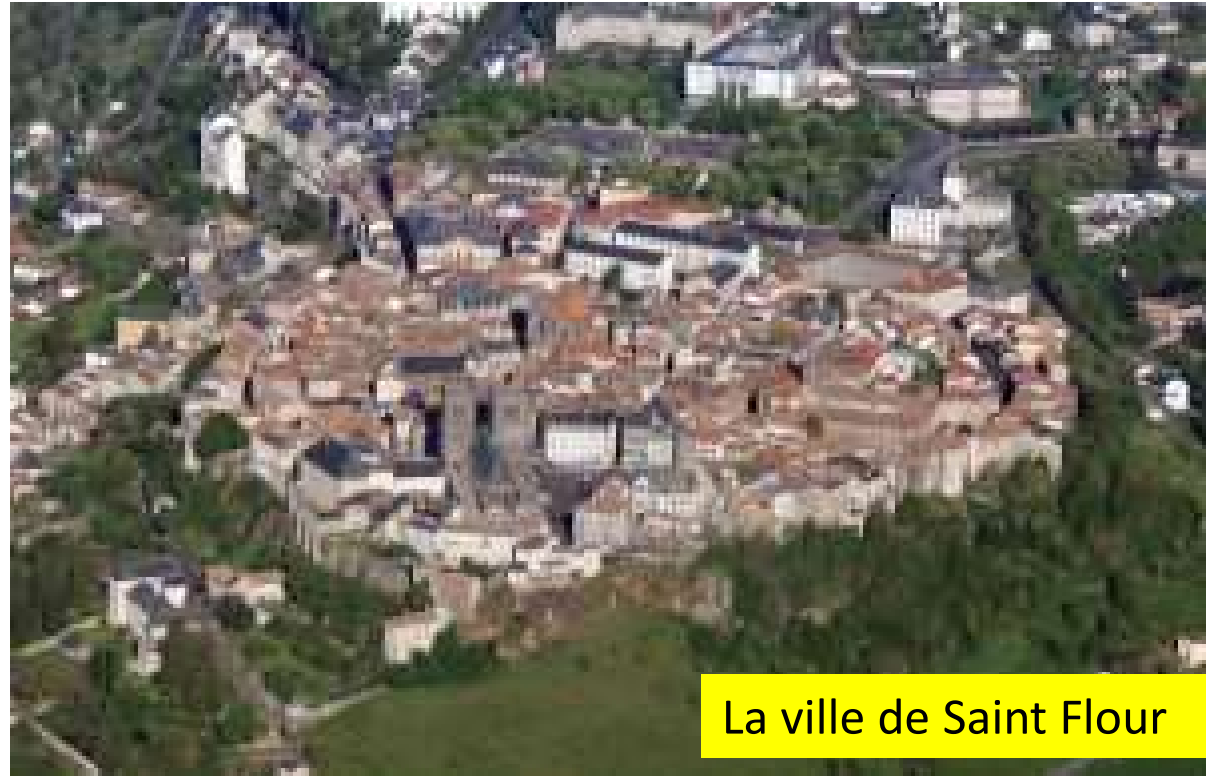
La ville de Saint Flour