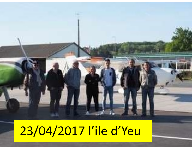
23/04/2017 l'île d'Yeu