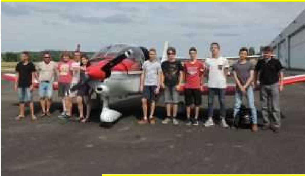
Le Brevet d'initiation Aéronautique (BIA)