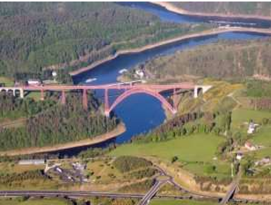
Viaduc de garabit