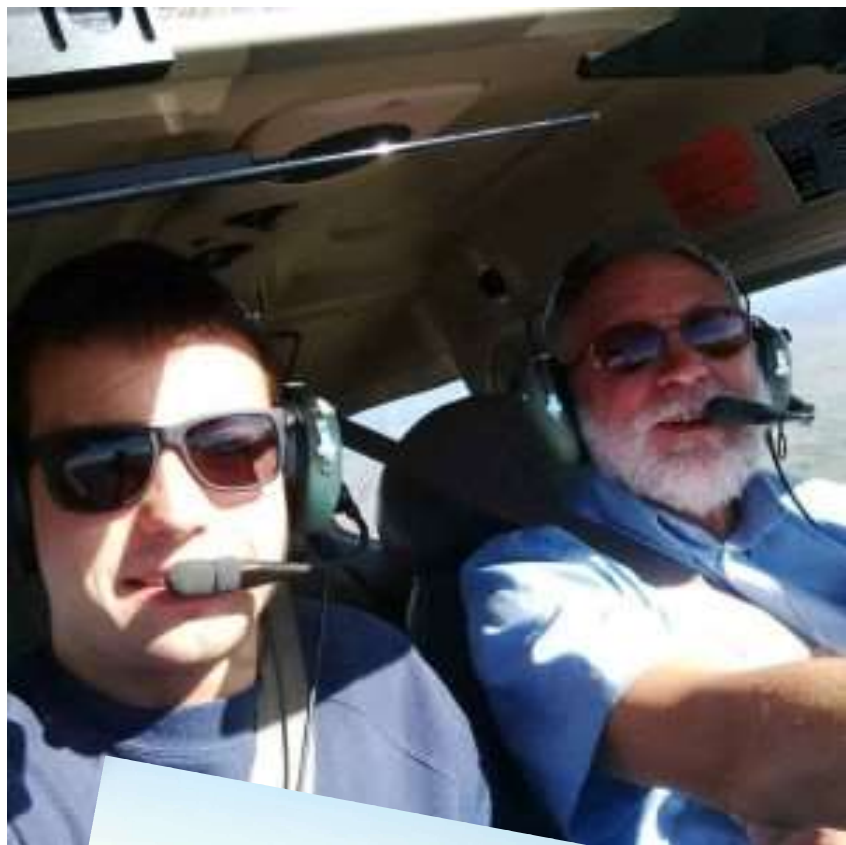
Le puy en Velay le 22 octobre