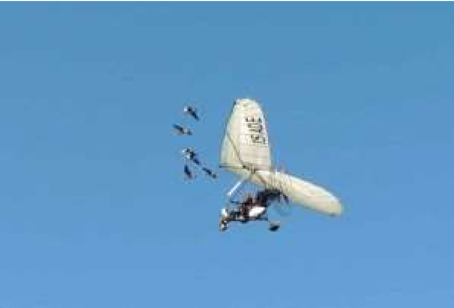
Saint Flour le vol avec les oies