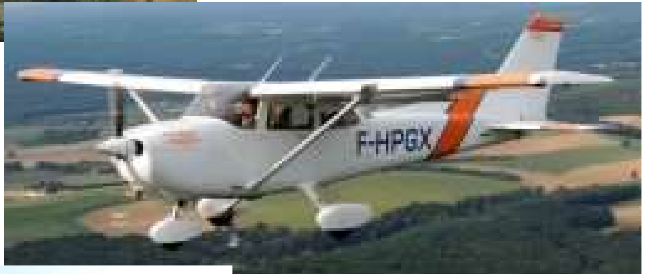
Le cessna 172