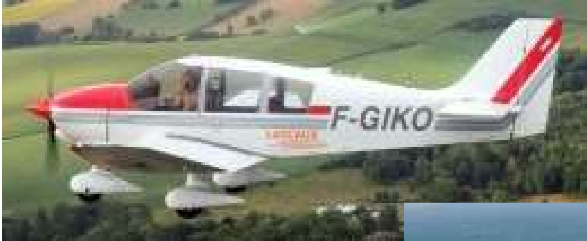
Le robin DR400